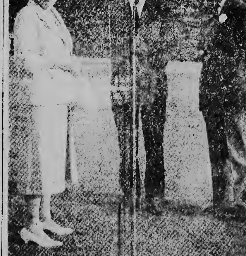
Dia Razoi atardi, algun minutu prome cu 6 or, S. M. Rey Baudewijn di Belgica a jga palacio Soestdijk pa un bisita no-oficial di dus dia na S.M. La Reina Juliana. Ariba e portret ayeri nan ta mira di izquierda pa derecho S.M. La Reina Juliana, S.M. Rey Baudewijn i S.A.R. Prins Bernhard den haratin tres di palacio.

De ARUBAANSE COURANT: Is... WOENSDAG 4 JUNI